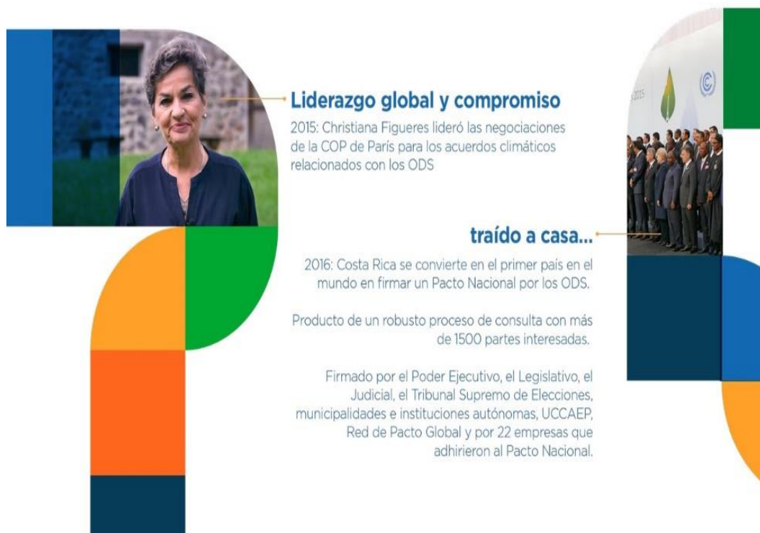
Costa Rica y el Pacto Nacional por los ODS